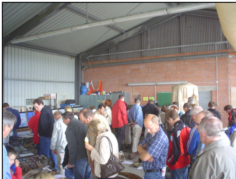
sehr groß ist der Besucherandrang

Das Interesse und der Informationsbedarf der Flugplatzfest-Besucher war bisher sehr groß und die Mitglieder der Gruppe mussten fast während der vergangenen Feste Fragen beantworten und erhielten auch neue Hinweise auf abgestürzte Flugzeuge in der Region.