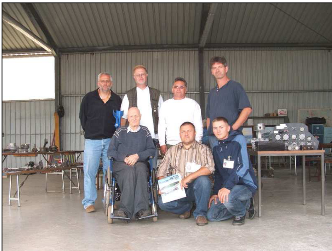
das Team 2007