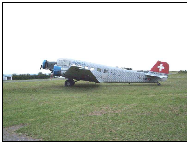
Junkers Ju 52 „Tante Ju“